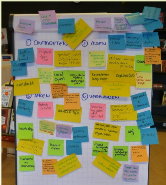
Foto van de vier thema's die de deelnemers benoemd hebben met op de post-its de steekwoorden die belangrijk zijn bij de thema's.

Resultaat: gedeelde associaties en beelden bij de kernthema's.