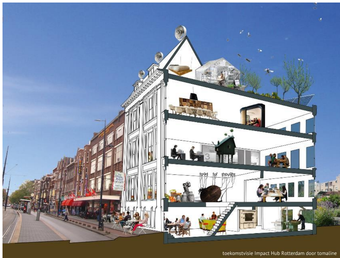
toekomstvisie Impact Hub Rotterdam door tomaline